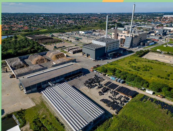
Kraftvarmeværk, biomasseværk og varmepumpeanlæg Endelavevej 7