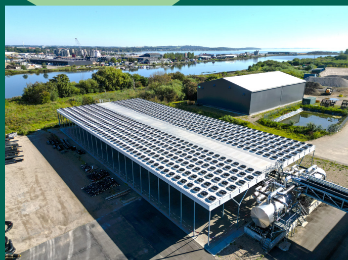
576 energioptagere Endelavevej 7